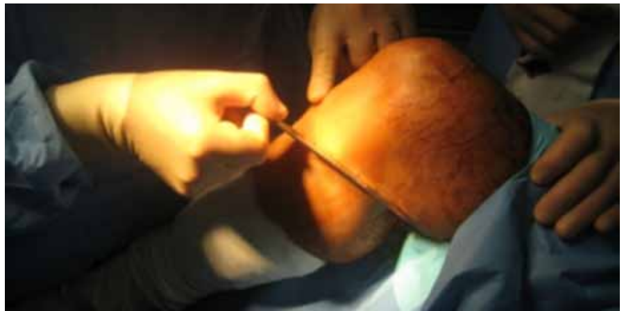
Figura 1. Abordagem para colheita de ST-G

A lesão neurológica como complicação da ligamentoplastia tem sido bastante documentada na literatura, mas a maioria dos trabalhos apenas foca a vulnerabilidade do ramo infrapatelar do nervo safeno (RIPNS) 14,23 . Segundo Eriksson 24 , após ligamentoplastia do LCA com ST-G pode surgir localizada mais distalmente uma área de défice sensitivo, que está relacionada com a lesão do ramo sartorius do nervo safeno (RSNS). A zona de défice sensitivo referida à face antero-medial do joelho pode estar em relação com a lesão (completa ou parcial) do RIPNS ou das fibras proximais do nervo safeno que comunicam com o RIPNS, lesadas durante a fase de stripping e/ou da incisão cutânea. Alterações da sensibilidade referidas à face medial da perna e do tornozelo estão relacionadas com a lesão neurológica do RSNS aquando da disseção e/ou identificação da inserção distal do ST-G no pes anserinus e/ou sua tenotomia. Neste contexto, a identificação da proximidade do nervo safeno com o ST-G sugeriu a “posição de 4”, com o joelho fletido e a anca em rotação externa, para a fase de recolha do enxerto (ST-G), no sentido de relaxar a tensão do nervo safeno à medida que este passa sobre o Gracilis 25, 26 . Boon et al. 27 descreve uma “área segura” para colheita do ST-G, por meio de uma