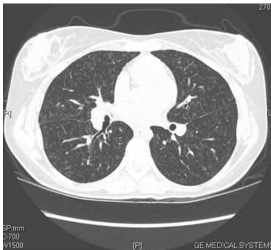
Figura 3: TAC torácica de alta resolução. Identifica-se uma opacidade micronodular em vidro despolido, dispersa por ambos os campos pulmonares

Outpatient therapy was begun with oxygen support, warfarin and bosentan (62.5 mg twice a day). Monthly clinical follow-up was maintained, but her clinical and functional status progressively worsened. In May 2007 she was in NYHA class III and besides her original symptoms, she reported orthopnea and exertional syncope. No signs of fluid overload were present. She achieved only 380 meters in the