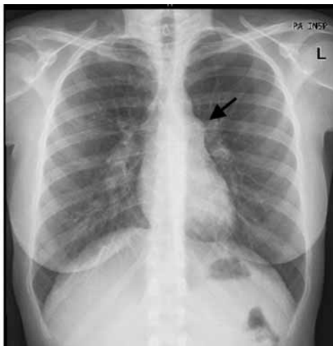
Figura 1: Telerradiografia tórax, incidência postero-anterior em Novembro 2006. É evidente uma prociência do arco médio – tronco da artéria pulmonar (seta).

BNP: brain natriuretic peptide; CK: creatine kinase; GGT: gamma-glutamyl transferase; GOT: glutamic oxalacetic transaminase; GPT: glutamic pyruvic transaminase; LDH: lactic dehydrogenase