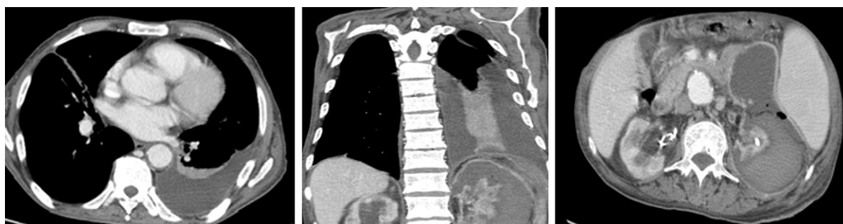
Figura 2 TC – Opacificação homogênea no andar inferior do hemitórax esquerdo, sugestivo de derrame pleural de pequeno/moderado volume.

0,2 mg/dL, hemoglobina 9,4 g/dL, 5 100 leucócitos/L, proteínas de 5,3 g/dL, e normal amilase e amilaseúria.